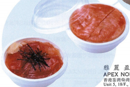
ミニ押し寿司弁当

雅麗盈設備有限公司 APEX NOBLE EQUIPMENT LTD. 香港荃灣柴灣角街95號華俊工業中心18樓05室 Unit 5, 18/F., Wah Chun Industrial Centre, 95 Chai Wan Kok Street, Tsuen Wan, New Territories, Hong Kong Tel.3690 1333 Website:www.anel.com.hk