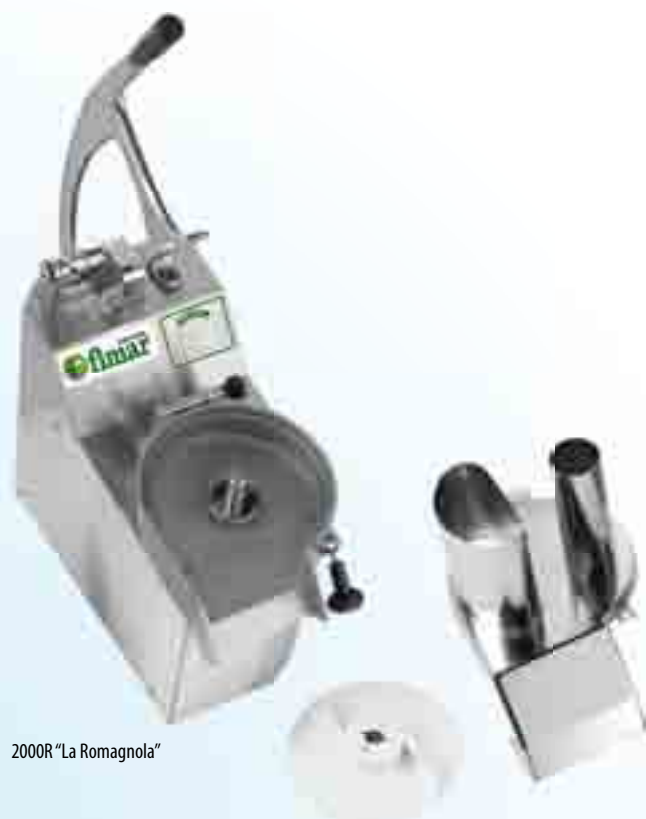
2000R "La Romagnola"

COUPE-LEGUMES 2500: Corps recouvert de peinture au polyuréthane anti-écaflures - goulotte en plastique apte au contact avec les aliments - microcontact de sécurité sur la poignée - double goulotte d'introduction - disponible uniquement en monophasé.