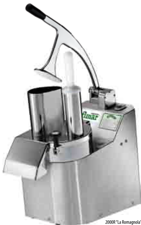
2000R "La Romagnola" 3000