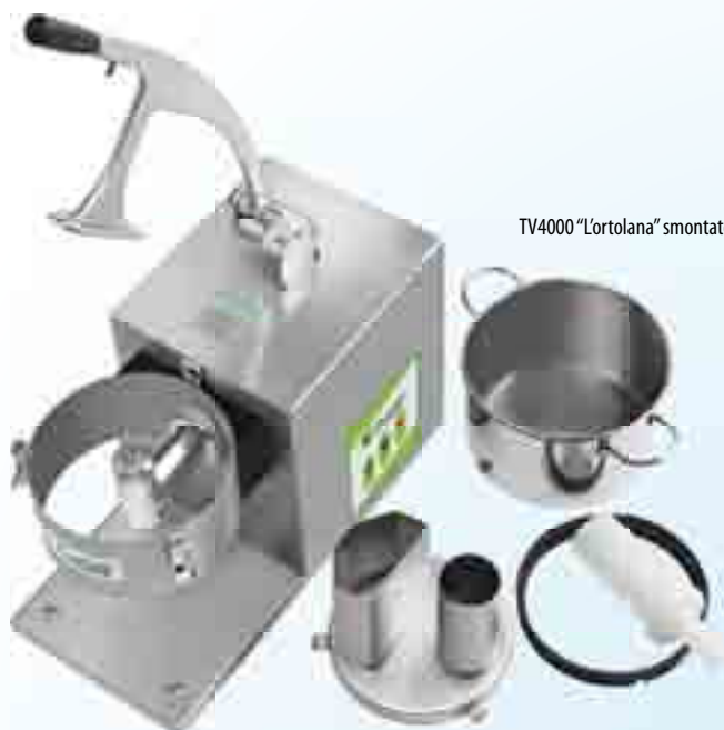
TV4000 "L'ortolana" smontato